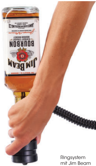
Ringsystem mit Jim Beam