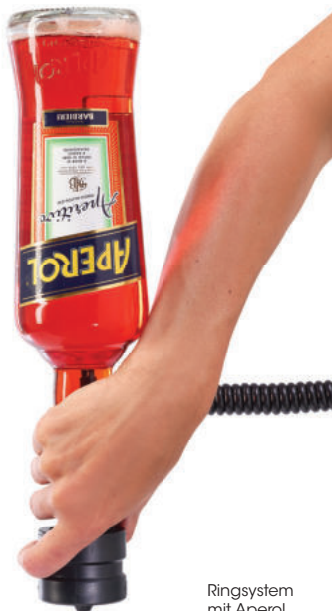
Ringsystem mit Aperol