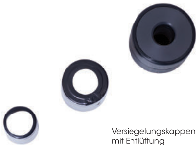
Versiegelungskappen mit Entlüftung